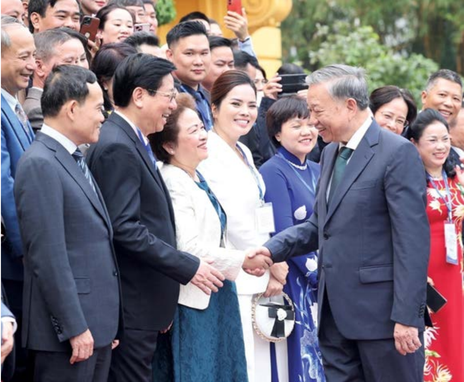
Tổng Bí thư, Chủ tịch nước Tô Lâm gặp mặt Đoàn đại biểu doanh nhân tiêu biểu của Liên đoàn Thương mại và Công nghiệp Việt Nam và Hội Doanh nhân tư nhân Việt Nam.

nước, trong thời gian qua nhận thức về vị trí, vai trò của đội ngũ doanh nhân đã có những thay đổi tích cực.