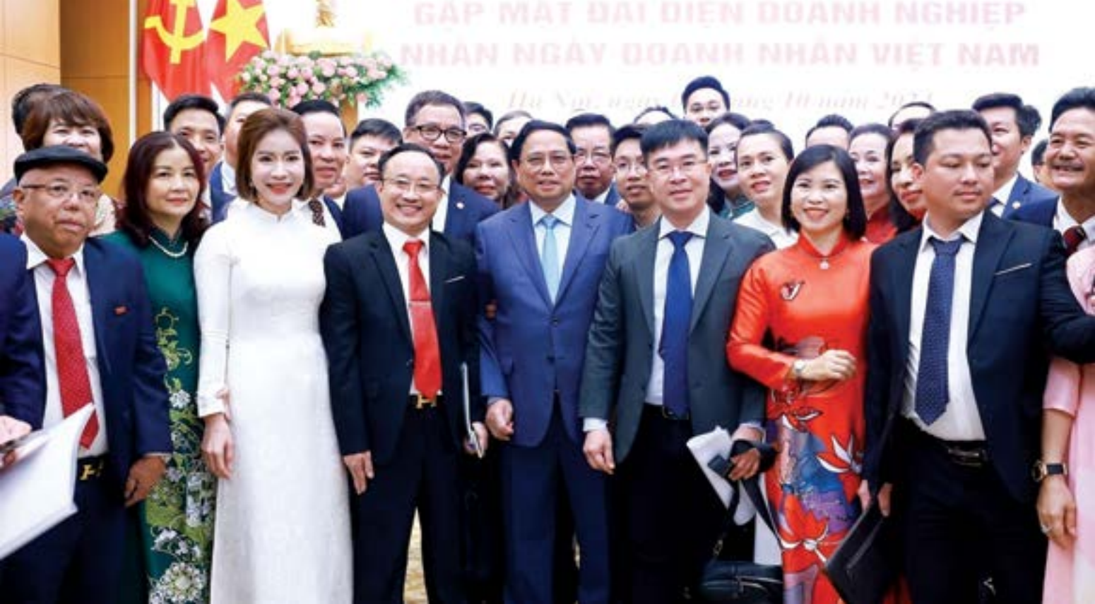
Thủ tướng Phạm Minh Chính không có đội ngũ doanh nhân giỏi thì dòng chảy kinh tế sẽ ngưng trệ và đất nước sẽ không thể thịnh vượng

Theo khảo sát của Bộ KH&ĐT mới đây, tình hình DN đã lạc quan hơn nhiều, niềm tin vào thể chế được củng cố, tỷ lệ DN đánh giá “tích cực” về kinh tế vĩ mô trong năm 2025 tới cao gấp 5 lần so với các kỳ khảo sát trước.