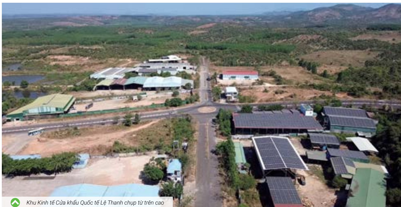
Khu Kinh tế Cửa khẩu Quốc tế Lệ Thanh chụp từ trên cao

con gieo trồng theo đúng quy trình kỹ thuật, phòng trừ sâu bệnh hại; công tác kiểm tra chất lượng vật tư nông nghiệp được quan tâm đúng mức, các cơ sở sản xuất kinh doanh vật tư nông nghiệp được kiểm tra định kỳ, góp phần hạn chế được tình trạng kinh doanh vật tư nông nghiệp giả, kém chất lượng. Công tác phòng, chống dịch bệnh gia súc, gia cầm được quan tâm và có sự phối hợp tốt giữa các phòng, ban chuyên môn của huyện với cấp cơ sở tương đối chặt chẽ, nên các loại dịch bệnh trên đàn gia súc, gia cầm được kiểm soát, không có dịch bệnh nguy hiểm xảy ra".