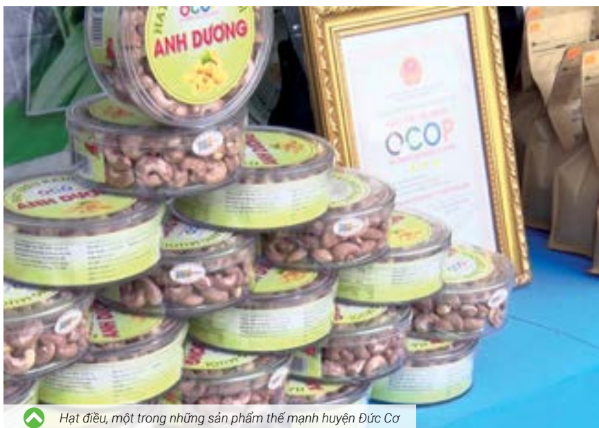
Hạt điều, một trong những sản phẩm thế mạnh huyện Đức Cơ

Trong 9 tháng đầu năm 2024, ngành Nông nghiệp và Phát triển nông thôn (PTNT) huyện Đức Cơ (tỉnh Gia Lai) vượt qua nhiều khó khăn, thách thức do tình hình thời tiết, dịch bệnh trên đàn vật nuôi, biến động của giá cả thị trường, qua đó đã đạt được nhiều kết quả tích cực.