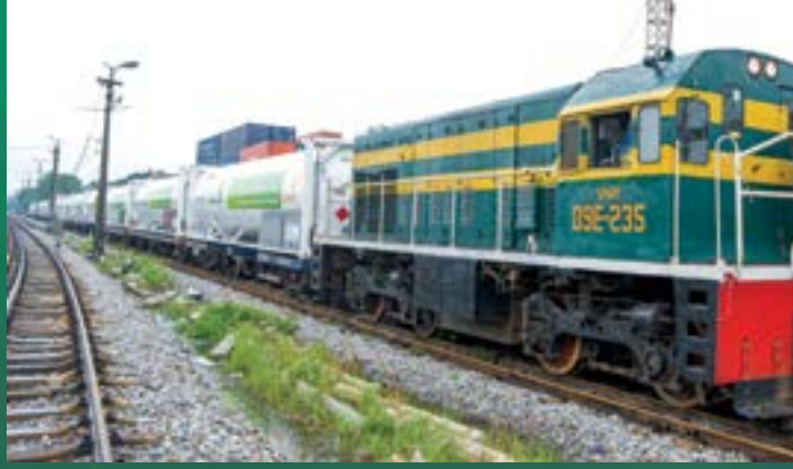
Đoàn tàu chở LNG đầu tiên đến miền Bắc đã hoàn thiện mô hình kinh doanh khí của PV GAS