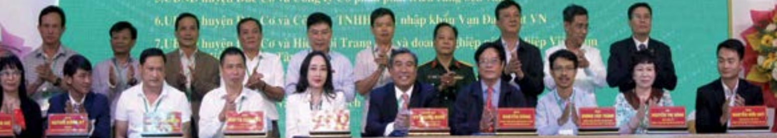
Lãnh đạo UBND huyện Đức Cơ và các nhà đầu tư ký kết ghi nhớ hợp tác đầu tư

điều là 14.775,53 ha, đạt 100,29% kế hoạch; cao su tiểu điền 6.287,93 ha, đạt 100,78% kế hoạch; cà phê 9.258,44 ha, đạt 100,59% kế hoạch; hồ tiêu 700,75 ha, đạt 102,75% kế hoạch.