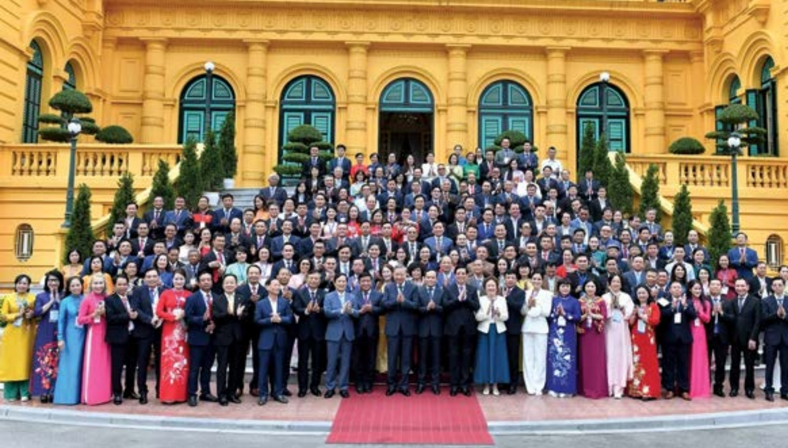
Chiều 11/10, tại Phủ Chủ tịch, Tổng Bí thư, Chủ tịch nước Tô Lâm gặp mặt Đoàn đại biểu doanh nhân tiêu biểu của Liên đoàn Thương mại và Công nghiệp Việt Nam (VCCI) và Hội Doanh nhân Tư nhân Việt Nam nhân Ngày Doanh nhân Việt Nam (13/10).